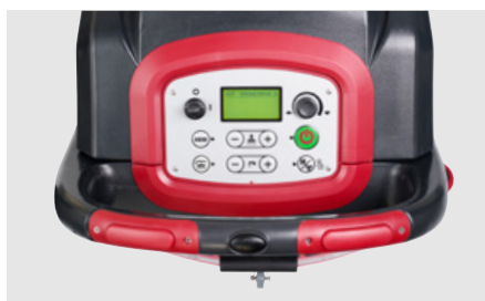
Panel de control intuitivo con pantalla LCD para todos los modelos (AS6690T/AS7690T en la imagen)