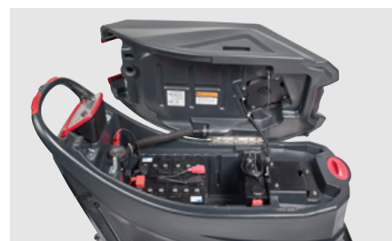
Depósito de recuperación con asa para facilitar la inclinación