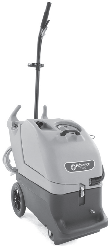
La imagen se muestra con AquaWand (Accesorio Opcional)

Los extractores portátiles ET610 son la culminación de una importante iniciativa de ingeniería y diseño de Advance que emana de la retroalimentación directa de técnicos de limpieza quienes usan extractores de alto rendimiento todos los días. El ET610 representa un espectacular avance en la implementación de características únicas que mejoran la productividad y consideran hasta el más mínimo detalle. Estas características van un paso más allá de los componentes tradicionales que los extractores comunes - bombas y motor de aspiración - y toman en cuenta las molestias más expresadas por los técnicos de limpieza. Por ejemplo, moverse a un lugar para llenar el tanque de solución donde el inevitable derrame que puede haber, no entre en contacto con componentes eléctricos o interruptores. Ningún detalle se pasó por alto.