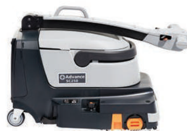
Mango ajustable, ergonómico, construido con sensores táctiles que simplifican y aseguran el restregado. El asa también se pliega para fácil transporte y almacenaje.