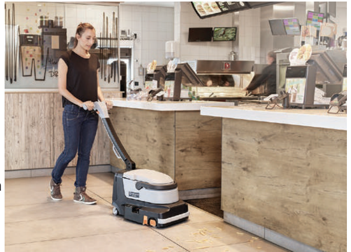
Eleva fácilmente el squeegee frontal para barrer pequeños residuos mientras se está restregando

La SC250 utiliza una batería de Litio de 36 V que otorga 40 minutos de operación y opera con sólo 66 dBA, permitiendo una limpieza diurna y en áreas sensibles al ruido. El diseño libre de cables asegura un ambiente de seguridad y opciones flexibles de limpieza.