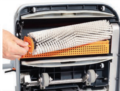
Mantenimiento libre de herramientas para el desmonte del cepillo y squeegee