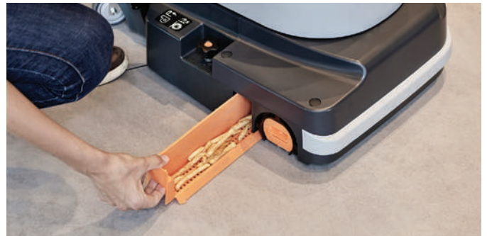
Fácil acceso a la caja de desechos para vaciar y limpiar.