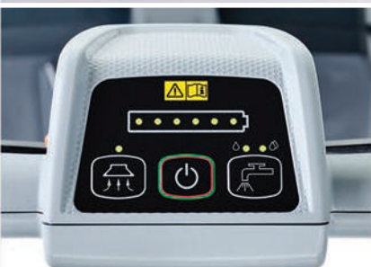
Dos ajustes de flujo de solución, indicador de baja solución y nivel de batería que aseguran una limpieza eficiente